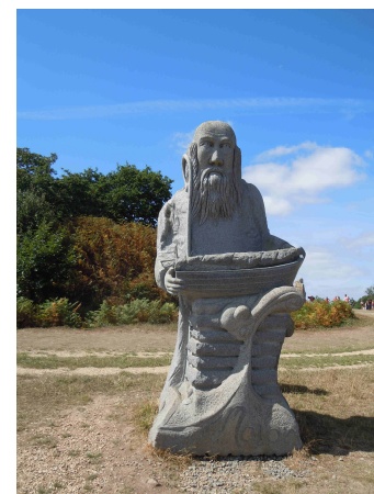
« Sant Malo »

« Sant Piran », saint patron de la Cornouailles britannique, a été créé à MABE (Cornwall), par Messieurs. Rouget et D.A. Paton et acheminé jusqu'à la Vallée des Saints grâce à de nombreux moyens de transport